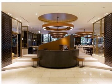
ホテル アゴーラ 大阪守口