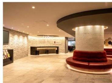
アゴーラプレイス 大阪難波