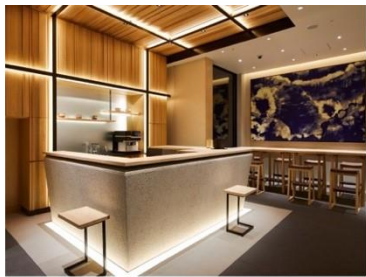
アゴーラ 東京銀座

アゴーラ ホスピタリティーズは、「美しい日本を集めたホテルアライアンス」をビジョンに掲げ、お客様の期待を超える最高の場所を提供するとともに、地域に貢献できる「街の自慢」となるホテルの創出を目指します。全国で9施設、客室数1,283室を展開。