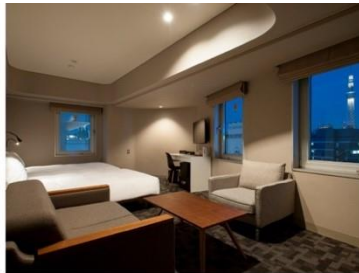
アゴラプレイス 東京浅草