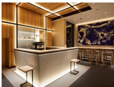
アゴーラ 東京銀座

アゴーラ ホスピタリティーズは、「美しい日本を集めたホテルアライアンス」をビジョンに掲げ、お客様の期待を超える最高の場所を提供するとともに、地域に貢献できる「街の自慢」となるホテルの創出を目指します。全国で9施設、客室数1,283室を展開。