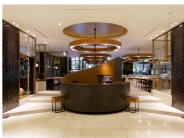
ホテル アゴーラ 大阪守口