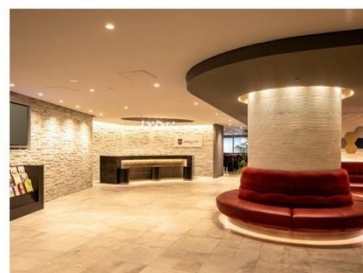
アゴーラプレイス 大阪難波