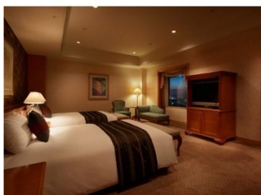
ホテル アゴーラ リージェンシー 大阪堺