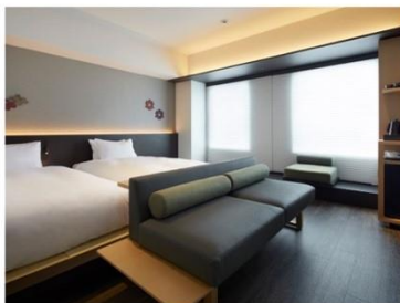
アゴーラ 京都四条