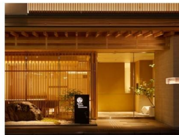
アゴーラ 京都烏丸