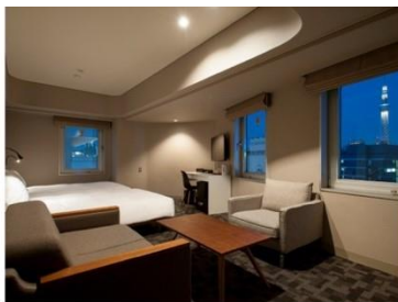
アゴーラプレイス 東京浅草