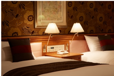
ホテル アゴラ リージンシー 大阪堺