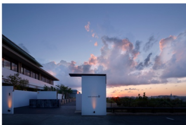
アゴラ福岡山の上ホテル&スパ