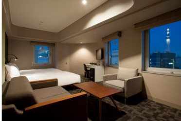
アゴラプレイス 東京浅草