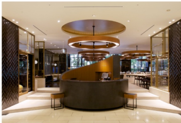
ホテル アゴラ 大阪守口