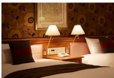
ホテル アゴラ リージンシー 大阪堺