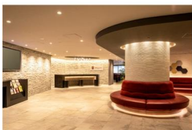
アゴラプレイス 大阪難波