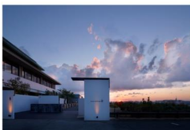
アゴラ福岡山の上ホテル&スパ