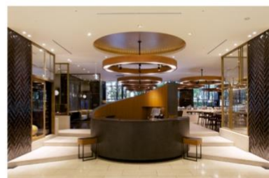
ホテル アゴラ 大阪守口