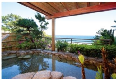
伊豆今井浜温泉 今井荘