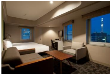
アゴラプレイス 東京浅草