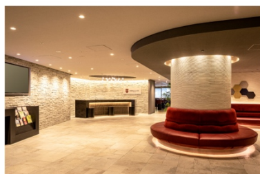
アゴラプレイス 大阪難波