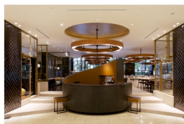
ホテル アゴーラ 大阪守口