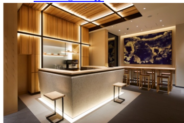
アゴーラ 東京銀座