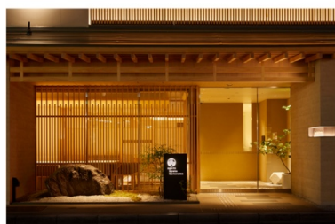
アゴーラ 京都烏丸