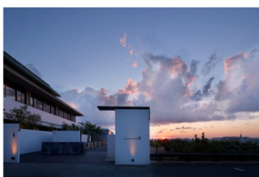
アゴーラ福岡山の上ホテル&スパ