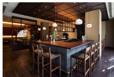
アゴーラ 京都四条