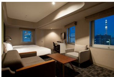
アゴーラプレイス 東京浅草