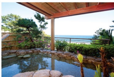
伊豆今井浜温泉 今井荘