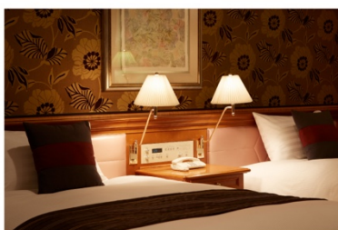
ホテル アゴーラ リージェンシー 大阪堺