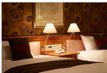
ホテル アゴラ リージェンシー 大阪堺