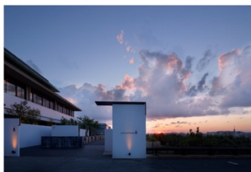
アゴラ福岡山の上ホテル&スパ