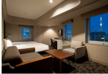
アゴラプレイス 東京浅草