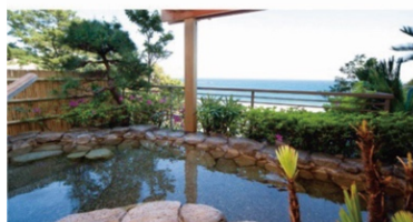
伊豆今井浜温泉 今井荘