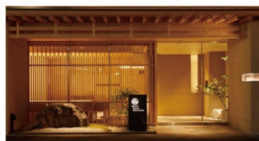
アゴーラ 京都烏丸