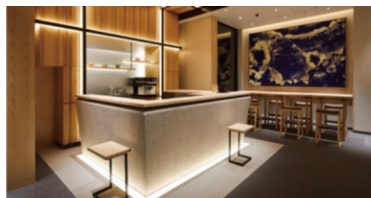
アゴーラ 東京銀座