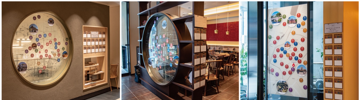
(左から、アゴーラ 京都烏丸、アゴーラ 京都四条、アゴーラ 東京銀座のまちごころマップ)

スタッフがおすすめしたい場所や、現地の通な人だけが知っているそのまちの魅力を「食、買い物、体験、歴史、自然」をそれぞれのカラーに分けてご紹介しており、QR コードを読み取ることで、そのスポットの詳細な情報をご覧いただける仕組みになっております。旅に訪れたお客様が実際の体験に基づいたリアルな情報を共有できる案内パネルをご用意し、書き込まれた感動の場所や魅力が、まちごころマップを介して、次のお客様へ伝えられ、お客様のさらなる感動へと旅のストーリーを紡いでいきます。