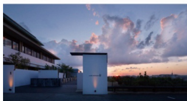
アゴーラ福岡山の上ホテル&スパ