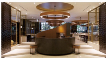
ホテル アゴーラ 大阪守口