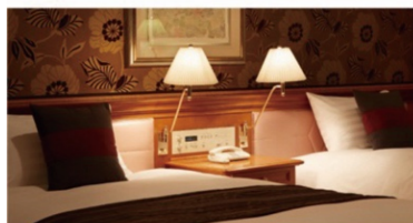
ホテル アゴーラ リージェンシー 大阪堺