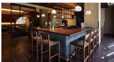
アゴーラ 京都四条