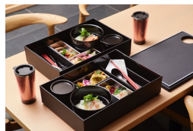
朝食 ※画像はイメージです