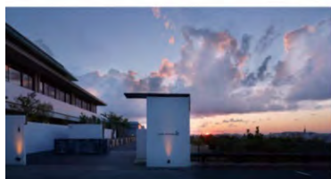
アゴラ福岡山の上ホテル&スパ