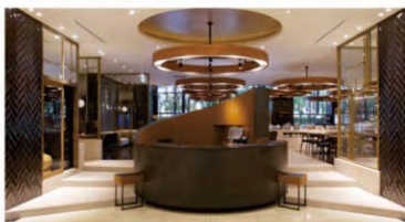
ホテル アゴラ 大阪守口