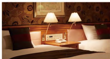
ホテル アゴラ リージェンシー 大阪堺