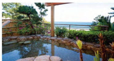
伊豆今井浜温泉 今井荘