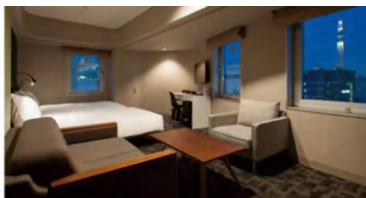
アゴラブレイス 東京浅草