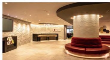
アゴラブレイス 大阪難波