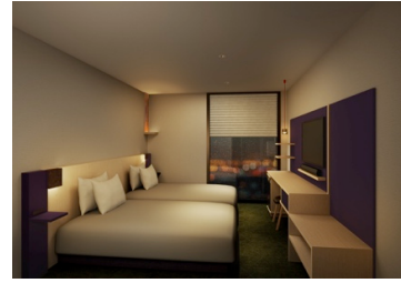
ツインルーム (20 m 2 )