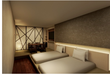
コンセプトルーム (29 m 2 )