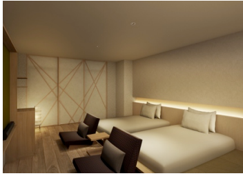
コンセプトルーム (25 m 2 )

客室は、茶の湯の心でお迎えする邸宅 (=茶邸) の客間として、茶道の心得である和敬清寂 (わけいせいじゃく) からそれぞれ名付けられ、全ての客室には、床の間を意味するスペースにお迎えの気持ちが設えられ、金沢らしい華やかさにシンプルさを兼ね備えた落ち着いた空間となっています。ホテルオリジナルの「九谷焼」の茶器で茶葉からお茶を淹れていただきゆったりとお寛ぎいただけます。