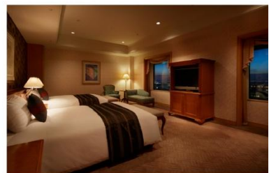
ホテル アゴラ リージェンシー 大阪堺