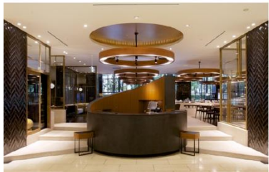
ホテル アゴラ 大阪守口