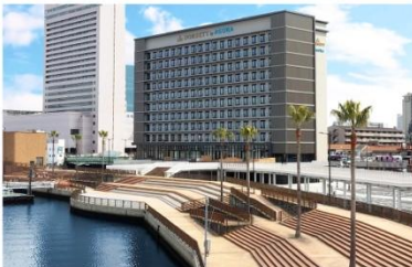
ドーセット バイ アゴラ 大阪堺