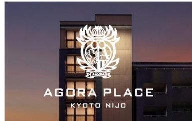
アゴラプレイス 京都二条 (2026年2月16日プレオープン)