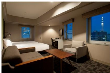
アゴラプレイス 東京浅草