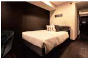
标准双人房(附设浴缸)