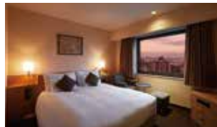
スーパーリアーダブル