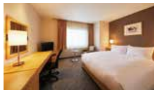
スタンダードダブル