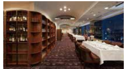
12F スカイバンケット