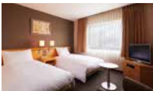
スタンダードツイン