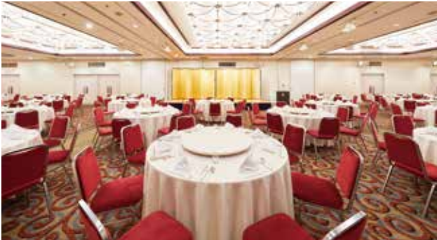
2F ロイヤルプリンセス