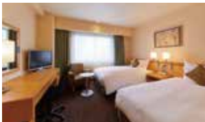
スーパーリアーツイン