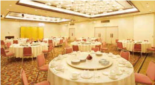
2F ロイヤルプリンセス