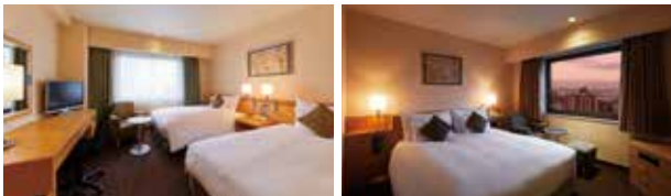
スーパーリアーツイン