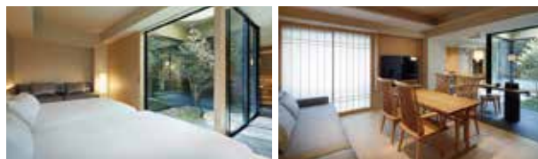
プレミアスイート