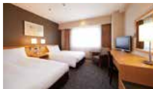
スタンダードツイン