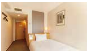
スタンダードシングル