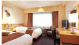
スーパーリアーツイン