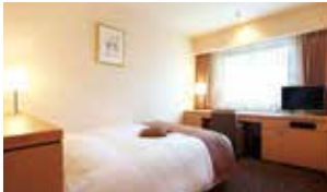
スーパーリアーシングル