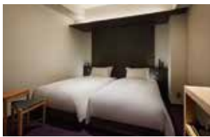
スーパーリアーツイン