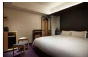
デラックスキング