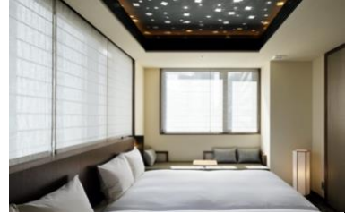
エグゼクティブスイート